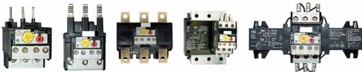
Relevos térmicos para las líneas CL y CK