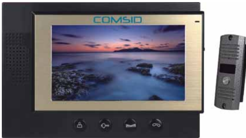
El portero visor de Comsid ofrece una gran cantidad de aplicaciones que lo distinguen.

inseguridad se planta como uno de los principales temas a tratar en cualquier agenda política. En este aspecto, se destaca además que el portero es a color, por lo que la definición de la imagen es superior, y es más claro para el que está adentro qué es lo que sucede afuera.