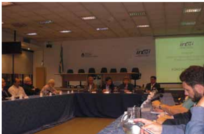
Debate en el Foro Sectorial