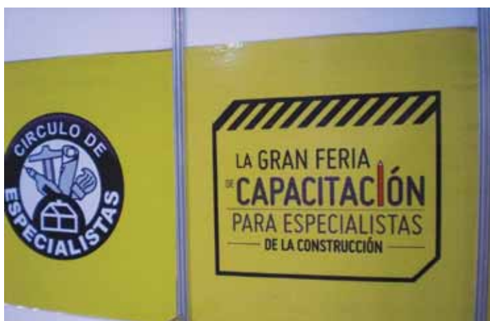
Feria de la Capacitación

Por su parte, el Ministerio de Educación, del que depende el Consejo Nacional de Educación Trabajo y Producción, sucesor del Consejo Nacional de Educación Técnica, cuenta a su vez con el Instituto Nacional de Educación Tecnológica (INET) que entre sus muchas funciones define los perfiles profesionales, actividad de la que ACYDE participa activamente en la actualidad en los debates del Foro Sectorial de su competencia administrado por el mencionado instituto.