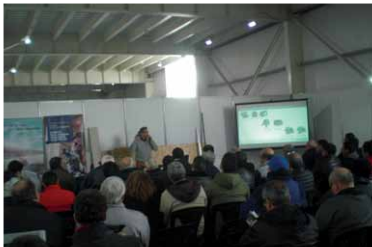
Instructor leyendo la pantalla y asistentes mirando sus celulares