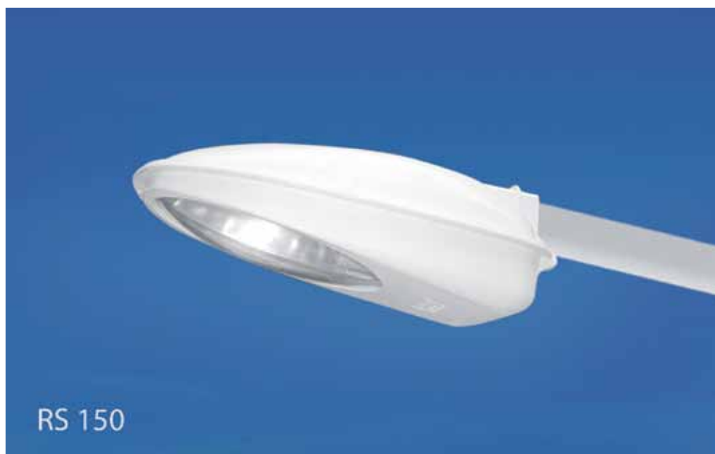
Luminaria marca Strand modelo RS 150