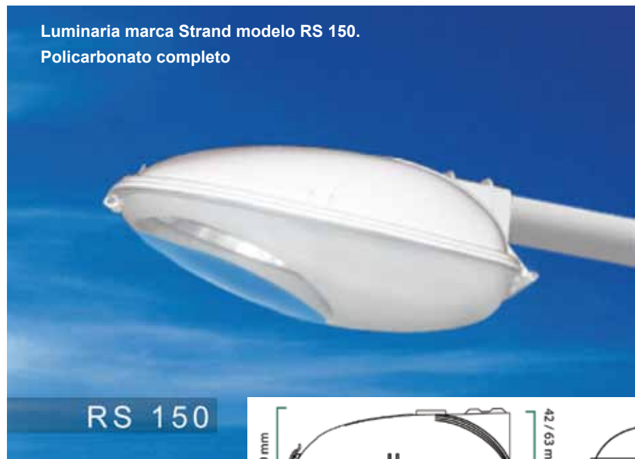
Luminaria marca Strand modelo RS 150. Policarbonato completo

STRAND S. A. agradece todos los datos proporcionados para la elaboración de esta nota.