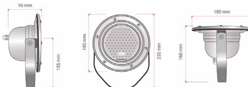
Medidas Cascada 100

Los dos modelos de Cascada, 50 y 100 se diferencian por las medidas: Cascada 50 mide 120 x 120 mm, mientras que Cascada 100, 180 x 180 mm. ■