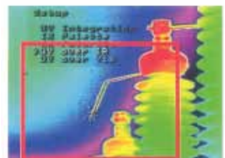
Figura 2. Imagen superpuesta de mediciones IR y de corona en la misma ejecución