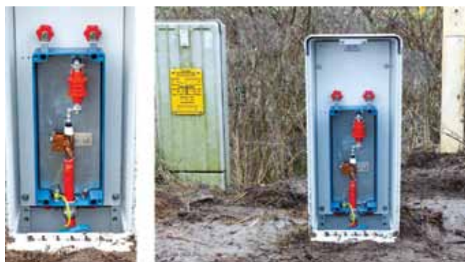
Ejemplo de montaje de la caja de conexión coaxial para una línea de etileno de larga distancia.