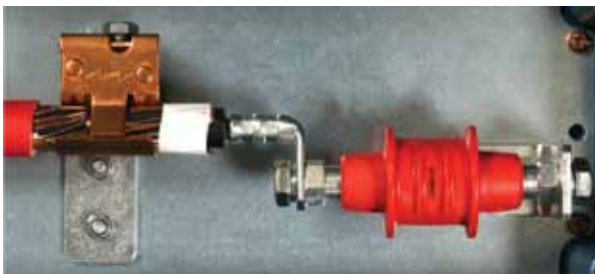
Caja de conexión coaxial con EXFS 100, vista de detalle con cable de conexión.

Para resolver estos serios problemas y evitar graves riesgos, DEHN desarrolló productos específicos, como el denominado Coax-Connection Box EXFS (código 999 990), que ubica la vía de chispas de separación en el exterior del tramo de tubería.