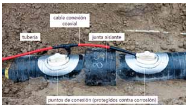
Conexión a la tubería utilizada para una línea de etileno de larga distancia.