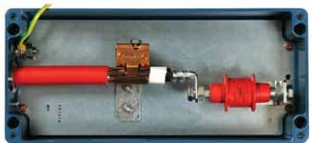
Caja de conexión coaxial con EXFS 100, vista interior con cable de conexión.

A su vez, el modelo Ex EXFS 100 (código 923100) fue diseñado para brindar solución a la protección de bridas de aislamiento en montaje bajo tierra, por ejemplo para el puenteo de bridas.