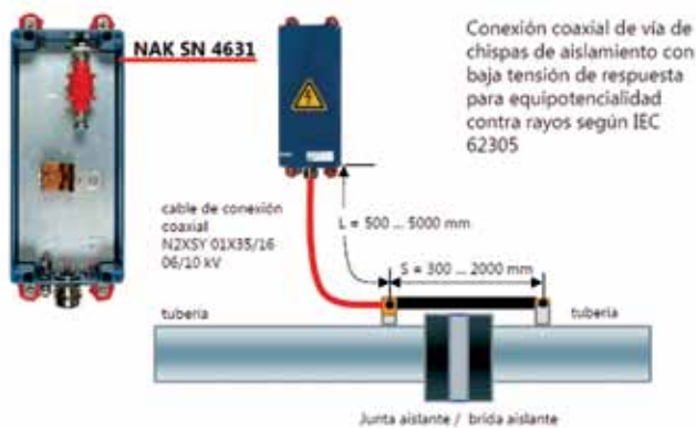
Caja de conexión coaxial Dehn con EXFS 100, principio de aplicación.