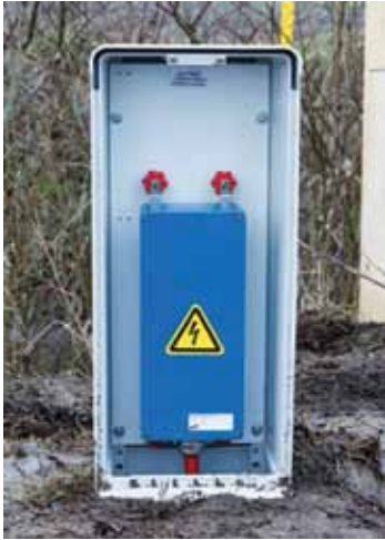
Instalación en envoltorio exterior.

potencialmente peligrosa y explosiva, descargan la energía producida por la sobretensión sin producir chispas.