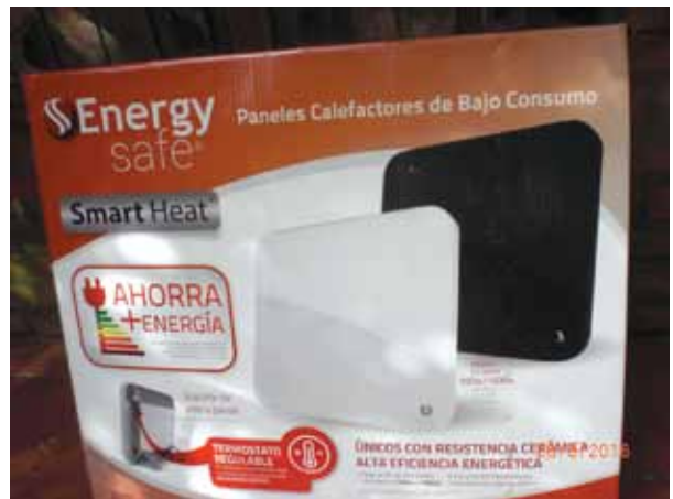
“Bajo consumo” es lo que dice la caja, no el contenido.

INSTALADOR. — Del ambiente exterior. Más aún, su equipo extrae del ambiente exterior toda la energía térmica que él