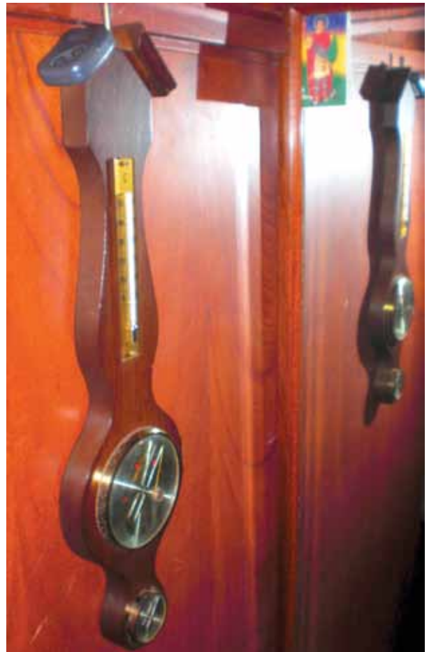
Barómetro doméstico que además contiene, arriba, un termómetro; abajo, un higrómetro. Guiándonos por el termómetro nomás, ya podemos empezar a ahorrar energía pagada de nuestro bolsillo, ahorrarle mucho gas a la Nación y cuidar nuestra salud.

INSTALADOR. — Son de menor consumo que otras que consumen más y que son tomadas como referencia. Fíjese que en la caja de las denominadas 'halógenas' que son de filamento al estilo de las dicroicas pero contenidas en una ampolla tradicional, el etiquetado de eficiencia energética las califica en un punto intermedio, asignándoseles por otra parte una duración de dos mil horas (2.000 h), mientras que la caja de las que tienen el tubito fluorescente plegado o en