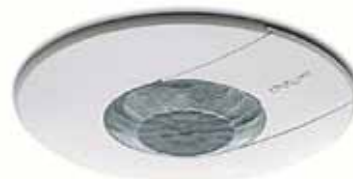
Detectores de presencia