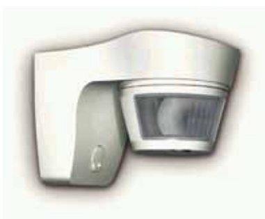
Detector de movimiento para interiores

La seguridad de los edificios empieza delante de ellos, con el "personal de seguridad" electrónico perfectamente formado, como los detectores de movimiento para exteriores. Siempre mantienen abiertos sus ojos infrarrojos y, en caso de que sea necesario, iluminan la oscuridad en fracciones de segundo.