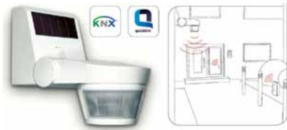
Detector de movimiento vía radio tebis.quicklink TRES30

En la vida laboral actual siempre se suele ir con mayor velocidad. La respuesta a estos tiempos trepidantes son los detectores de movimiento para interiores.