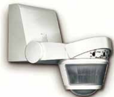
Detector de movimiento para exteriores

Se proporciona mayor seguridad al circular sobre superficies mojadas y heladas, permite ver los escalones y las piedras del camino, antes de que sea tarde, y pone a la fuga las visitas indeseadas.