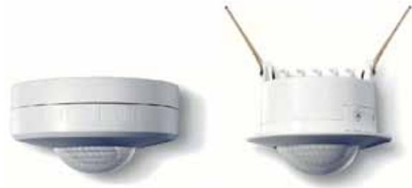
Detectores de movimiento para empotrar

elevada como, por ejemplo, con los detectores de movimiento Hager para techos.