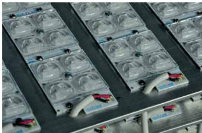
Los módulos led fabricados por Strand aseguran una larga vida útil a las luminarias

Con esta nueva luminaria, la empresa, como hace más de cincuenta años, demuestra su liderazgo en las nuevas tecnologías de iluminación, y ha desarrollado en su planta la fabricación de los módulos o plaquetas de leds modelo FX220 , partiendo de leds de la marca CREE , la mejor calidad reconocida a nivel mundial, para leds blancos, ensamblados con componentes y lentes de industria argentina.