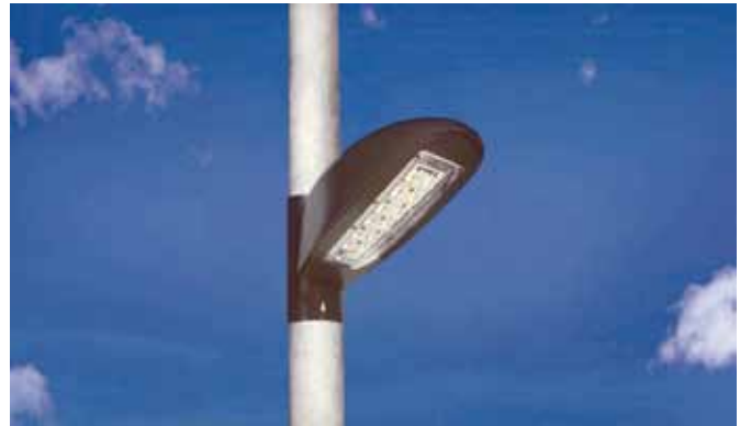
Nueva luminaria RC 30 Led, de Strand

El diseño compacto se potencia con la robustez habitual de las luminarias Strand , pues su carcasa monolítica está construida en una sola pieza de aleación de aluminio, fabricación que también corresponde al marco