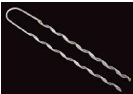
Retención de aluminio para fibra óptica ADSS