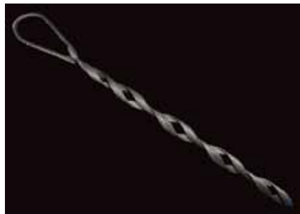
Retención de acero para fibra óptica ADSS