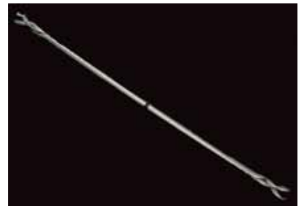
Camisa de acero para protección de fibra óptica ADSS