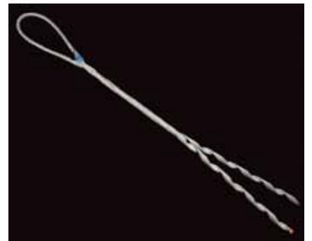
Retención de acero de anclaje

Para utilizar con conductores de aluminio-aluminio, se presenta la atadura de aluminio tipo “Z”, disponible en un rango amplio de medidas y también de tipos de aisladores. Asimismo, ataduras tipo “A” y tipo “V”.